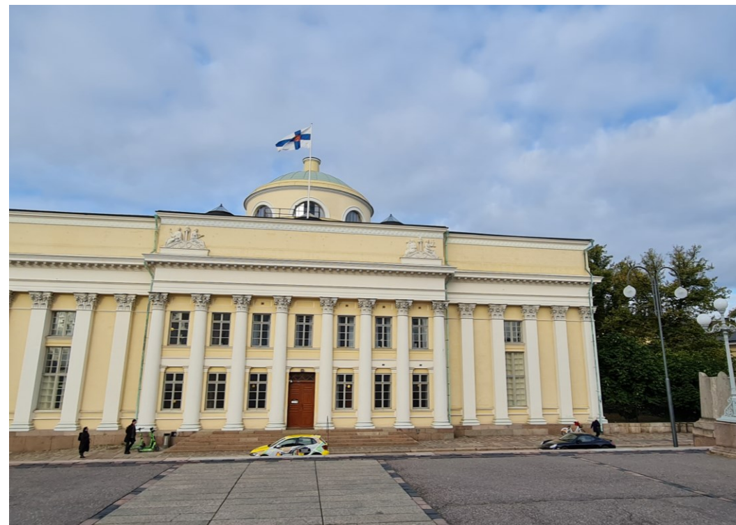
Budova Národní knihovny