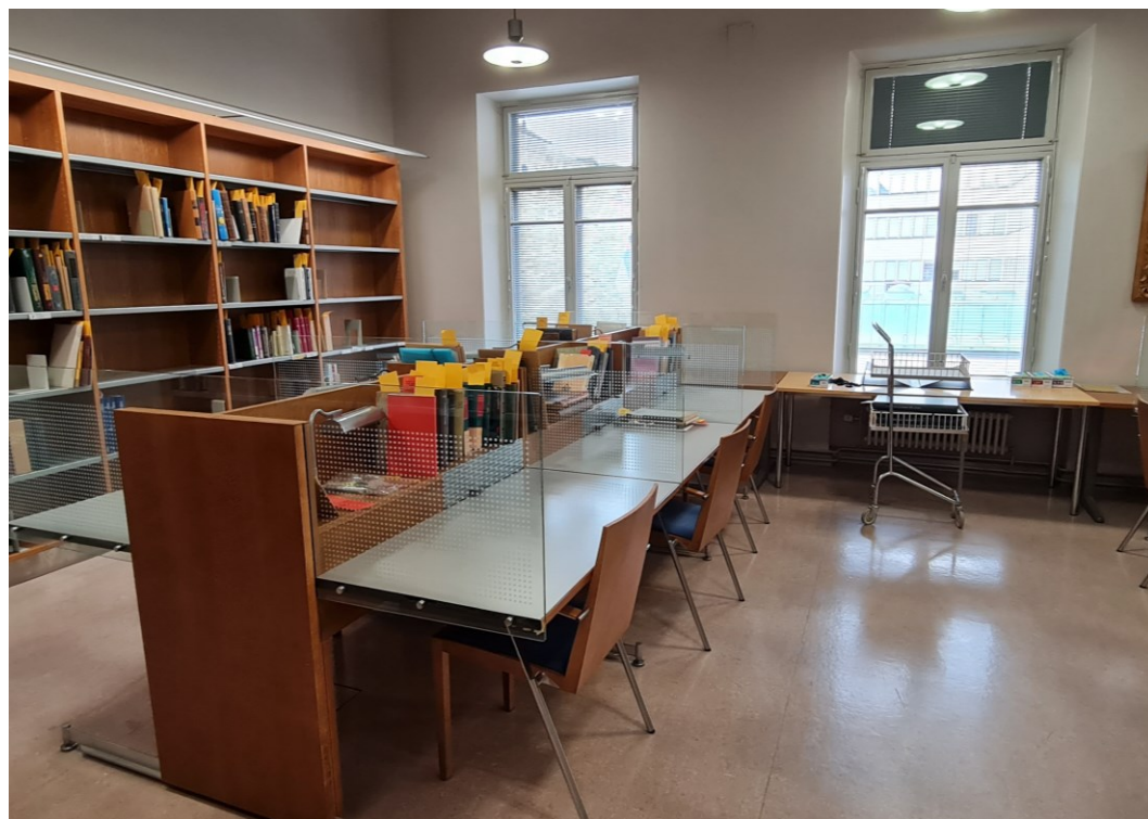
Exkurze do Slovanské knihovny

Národní knihovna České republiky National Library of the Czech Republic