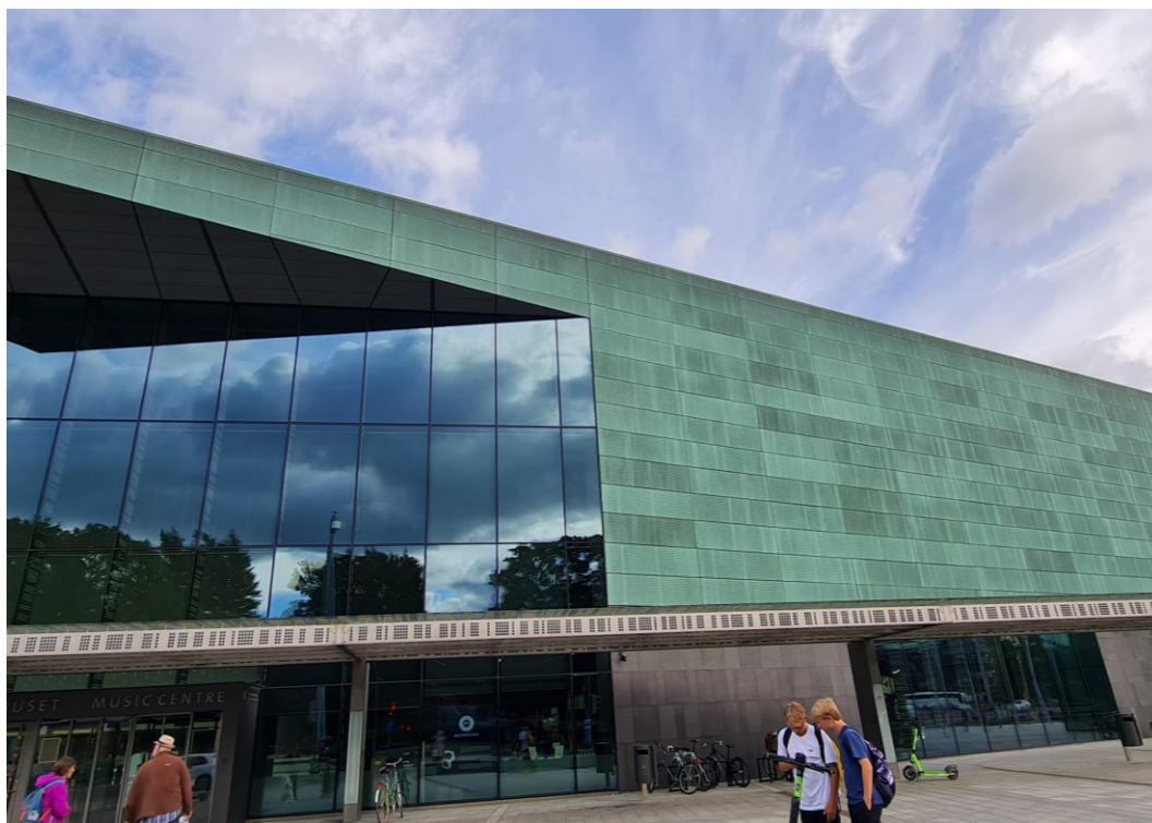
Městská knihovna v Helsinkách Oodi. V r. 2019 na světovém kongresu IFLA byla vyhlášena jako nejlepší knihovna na světě.

Národní knihovna České republiky National Library of the Czech Republic