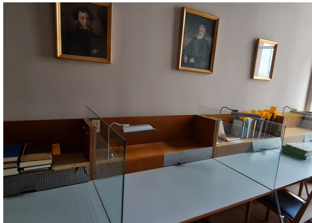
Exkurze do Slovanské knihovny